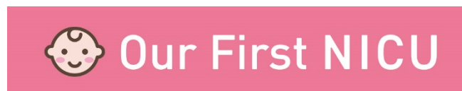
【web サイト 英語ロゴ】

新型コロナウイルス感染症対策のため、多くの病院において、NICU/GCU に入院している赤ちゃんのご家族との面会が制限されています。一部の NICU/GCU では、オンライン面会等の新たな取り組みが行われていますが、全国的に赤ちゃんのご家族との愛着形成が大きな課題となっています。