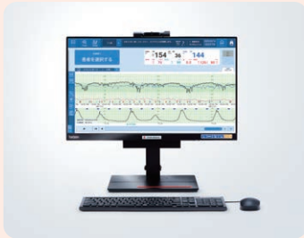
母体胎児監視システム アトム セントラルシステム CS3