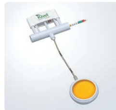
キウイ娩出吸引カップ オムニカップ 承認番号:21600BZY00662000