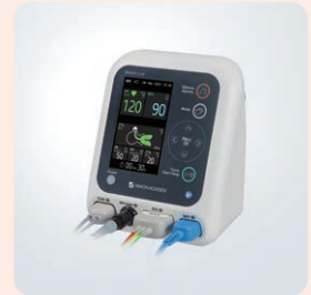
新生児蘇生モニタ プレスキュー NRM-1300