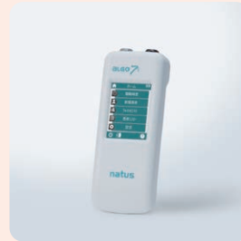
新生児AABR聴力検査装置 ネイタスアルゴ 7i