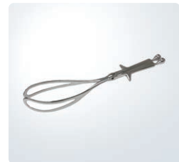
東大式ネーグリ鉗子 届出番号:11B1X00002Z39024