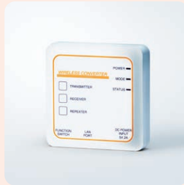
分娩監視装置オプション アトム無線ユニット