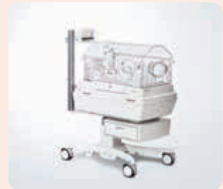
保育器 インキュ i α