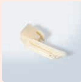
新生児喉頭鏡ブレード Premie6

販売名:アトム新生児喉頭鏡ブレード Premie6 届出番号:11B1X00002Z50012