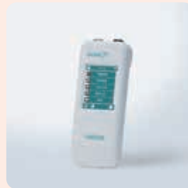
新生児用AABR聴力検査装置 ネイタスアルゴ 7i

販売名:アトム新生児喉頭鏡ブレード Premie6 届出番号:11B1X00002Z50012