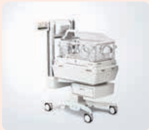
保育器 デュアル インキュ i α