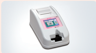
血液凝固分析装置FibCare

届出番号:14B3X000010000KP 製造販売元:株式会社エイアンドティー