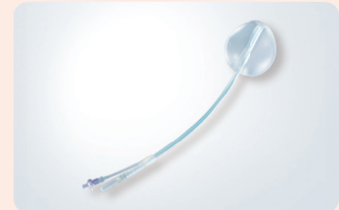
アトム子宮止血バルーン