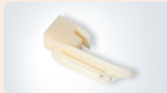
新生児喉頭鏡ブレード Premie6

届出番号:14B3X000010000KP 製造販売元:株式会社エイアンドティー